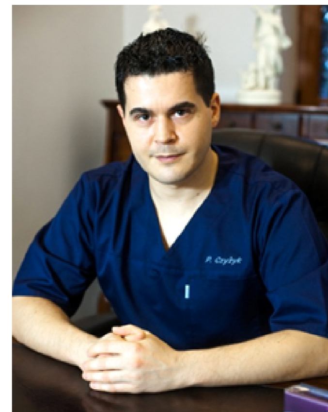
Informacji udziela dr Przemysław Czyżyk Klinika Chirurgii Plastycznej Artplastica www.artplastica.pl

Zawrotna kariera botoksu spowodowała wysyp samozwańczych „specjalistów”, których znikome doświadczenie może nam wyrządzić więcej szkody, niż rzeczywistej popra-