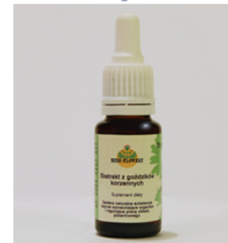
Ekstrakt z goździków