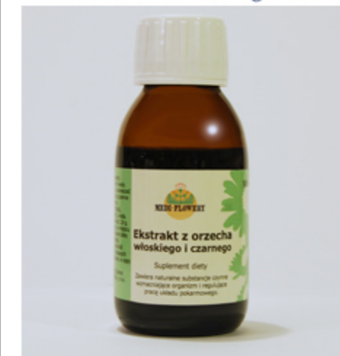
Ekstrakt z orzecha włoskiego i czarnego