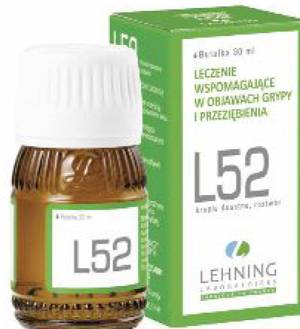
lek homeopatyczny złożony

Gdy męczy nas przeziębienie, grypa, często „katujemy” się lekami, które w swoim składzie mają samą (popularnie mówiąc) „chemię”. Nie dość, że nie zawsze są skuteczne, to dodatkowo jesteśmy narażeni na przeróżne działania uboczne. Dodatkowo, po leczeniu takimi specyfikami bardzo słabnie nasza odporność, przez co chorujemy częściej. Podczas przeziębienia i grypy warto sięgnąć po leki naturalne – np. doskonały L 52 z oferty